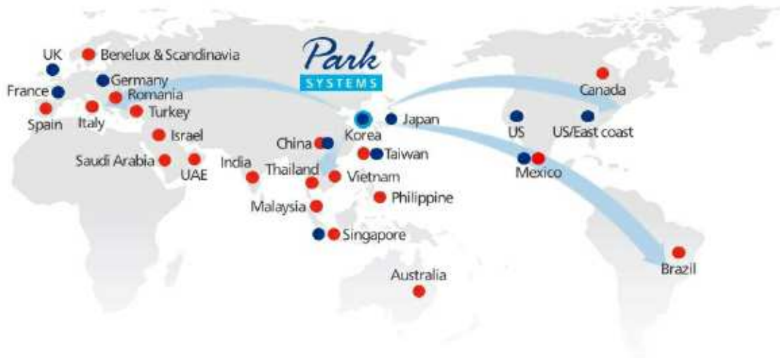
Global Sales Network